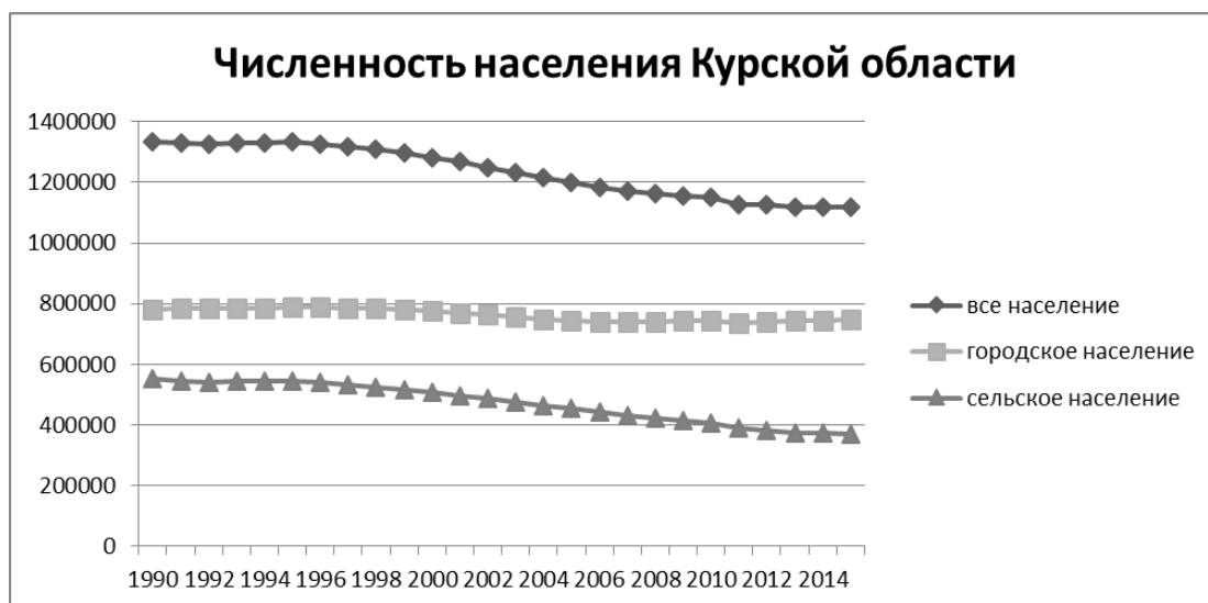
Рис. 1. Динамика численности населения Курской области

бальными и влияют на состояние демографической обстановки во всем мире. И учитывая эту особенность, анализ естественного воспроизводства населения Курской области проводился с учетом определенных параллелей глобализации влияющих факторов. Это фиксировалось и подтверждалось не только в исследуемом регионе, но и на опыте других стран и областей.